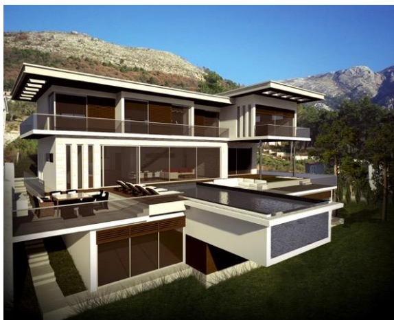
Glavni projekat – Privatne vile -, u Kotoru – 800m 2 , 2014.g.