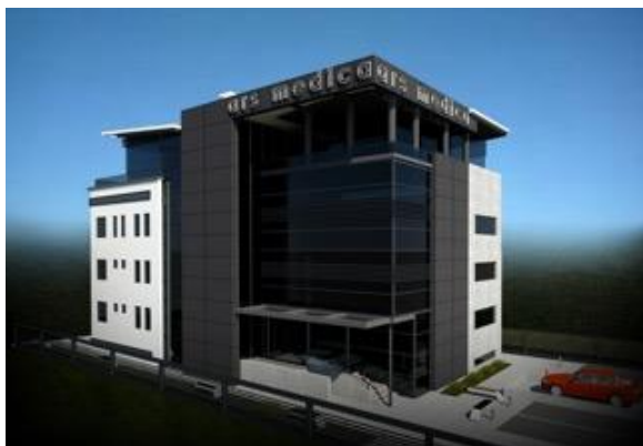
Glavni projekat- Zdravstvenog objekta Ars Medice DUP "Momišići A" u Podgorici, - 2.000m 2 2012. god.,