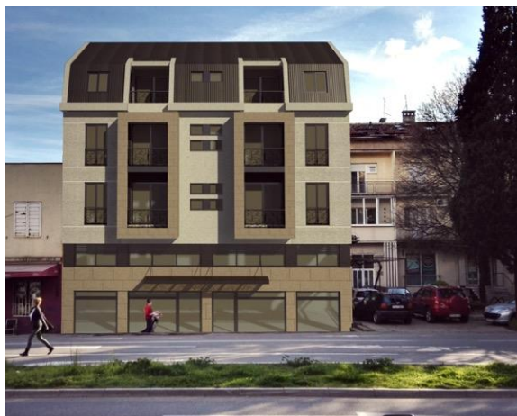
Glavni projekat – Poslovnog-stambenog objekta DUP-a "Nova Varos". u Podgorici – 800m 2 , 2014.g.