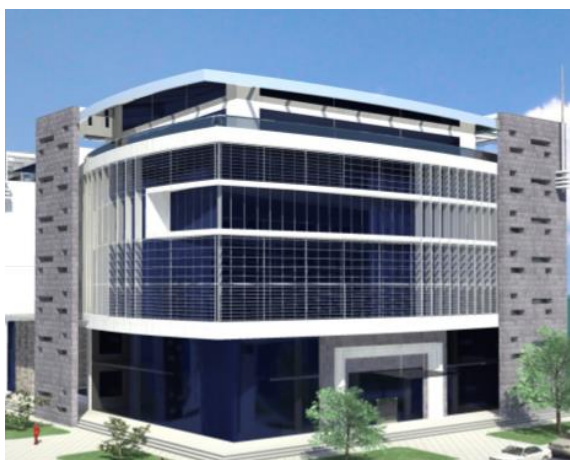
Glavni projekat - Poslovni objekat Crnogorske akademije nauka i umjetnosti - DUP "Nova Varos2", u Podgorici - 7.000m 2 , 2009.g.