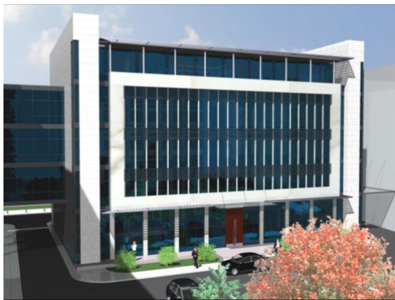
Glavni projekat i projekat enterijera Nove zgrade Vlade Crne Gore DUP "Nova Varoš" u Podgorici, - 8.000m 2 2007. god.,