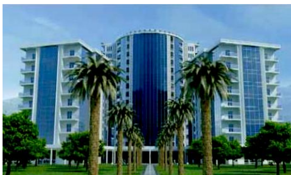
Glavni projekat –Apart hotela TRE CANNE – DUP "Budva centar" "Budva (I faza) 35.000 m 2 , 2009. god.,