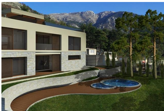
Glavni projekat – Privatne vile – DUP "Kavac" 'Kotor 400 m 2 , 2015. god.,